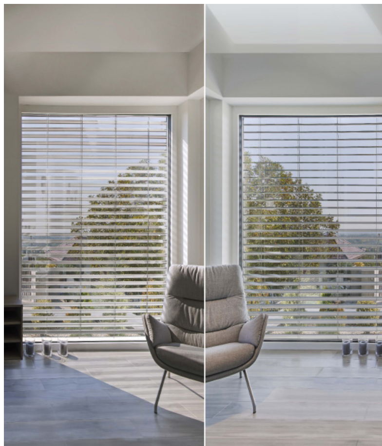
Der Vergleich macht sicher: Links kommen Standardlamellen zum Einsatz, im Bild rechts spezielle Lamellen mit optimaler Lamellengeometrie (siehe unten)

Ein Forschungsprojekt an der Neuen Mittelschule Adnet zeigt, dass jene Klassen mit mehr Tageslicht durch spezielle Tageslichtlamellen weniger unter Stress und Müdigkeit litten, zudem wurde der Stromverbrauch reduziert.